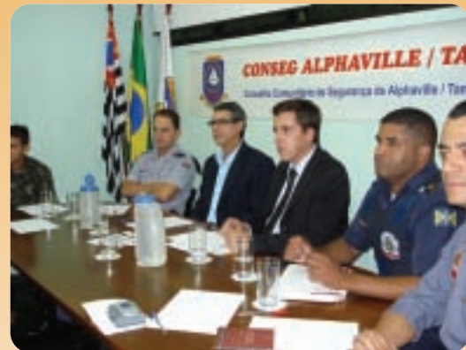
As reuniões – últimas quartas-feiras do mês, na sede da AREA.