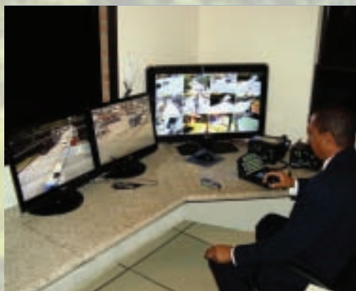
Central de monitoramento - Socet.

"O criminoso sempre está a procura de oportunidades, dificulte ao máximo a ação deles, fique alerta e lembre-se! a Polícia Militar é um dos poucos serviços públicos que funcionam 24hs ininterruptamente.