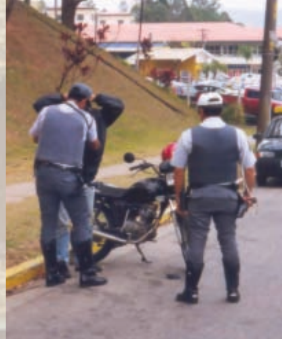
A atenção da PM voltada para as motos e garupas.

Atualmente com um novo sistema de gerenciamento criminal implantado pelo Comando de Policiamento Metropolitano Oito a sala de situação está revelando sua real importância, pois é um local ideal para os Comandantes de Companhias se reunirem e discutirem as estratégias de policiamento para fazer frente à criminalidade da região.